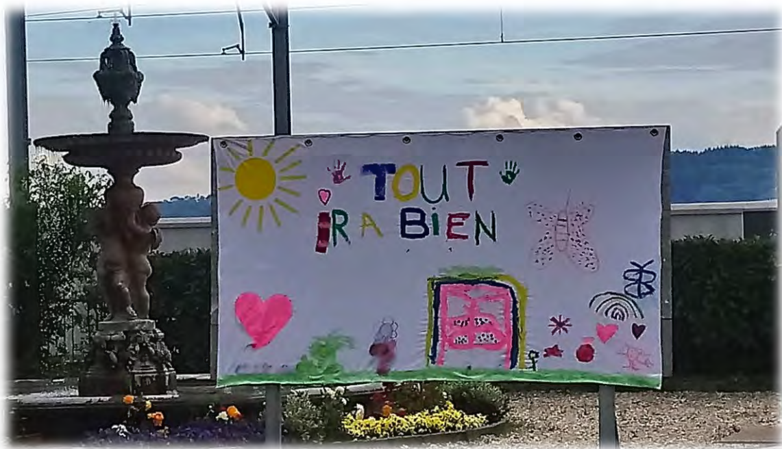
Photo prise le 27.04.20, gare de grandson.

Les membres de la Commission de gestion ont constaté une bonne collaboration entre les différents Dicastères et encourage la Municipalité à consolider cette bonne entente.