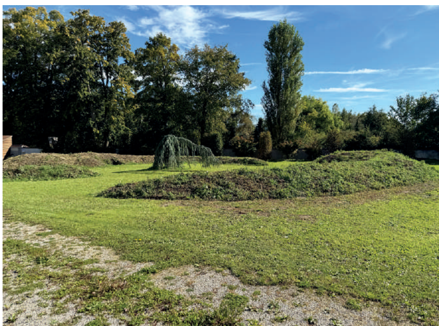
Emplacement pour la création d'un nouveau jardin du souvenir.

En parlant de nouveaux aménagements justement, des réflexions ont été entamées afin de créer un nouveau jardin du souvenir , le site actuel arrivant au maximum de sa capacité. Le projet est d'aménager un lieu de recueillement à la fois accueillant et intime. Il a été décidé de créer des buttes de terre végétale de différentes formes afin d'y planter des arbres. L'objectif est de constituer trois «petites forêts» composées de végétaux variés. L'espace destiné à l'entreposage des cendres se trouvera au pied de ces trois zones entièrement végétalisées . Des panneaux explicatifs décriront les essences sélectionnées. La population pourra ainsi choisir où déposer les cendres, en fonction d'un lien particulier avec certains végétaux présents dans les plantations. Cet espace d'environ 800 m 2 sera réalisé suite à la demande de la population de disposer d'un lieu accueillant où les visiteurs pourront se recueillir à l'ombre des arbres. Des cheminements perméables seront aménagés et des prairies fleuries seront également semées afin de créer des refuges pour la biodiversité locale.