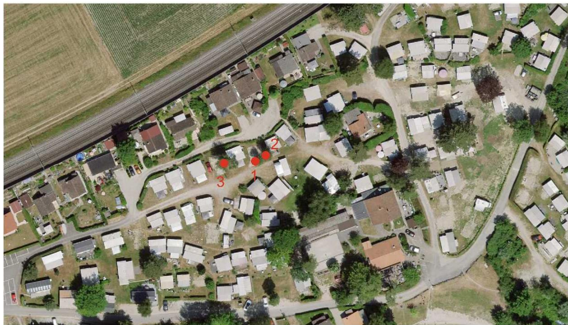
Camping des Pins