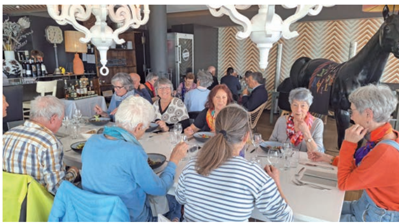
La table au bistrot de Grandson réunit des seniors entre 65 et 93 ans.

A l'adresse: Ch. du Lac 43. Le prix du repas, café compris est de 23 francs par personne. Les inscriptions doivent être prises 48h à l'avance. Bénévole: Ghislaine Echavé Tél.: 077 410 12 50. Prochaine date: 12 juin 2024. Pour plus d'informations sur les tables conviviales: Christine Logoz, animatrice. 024 425 78 36.