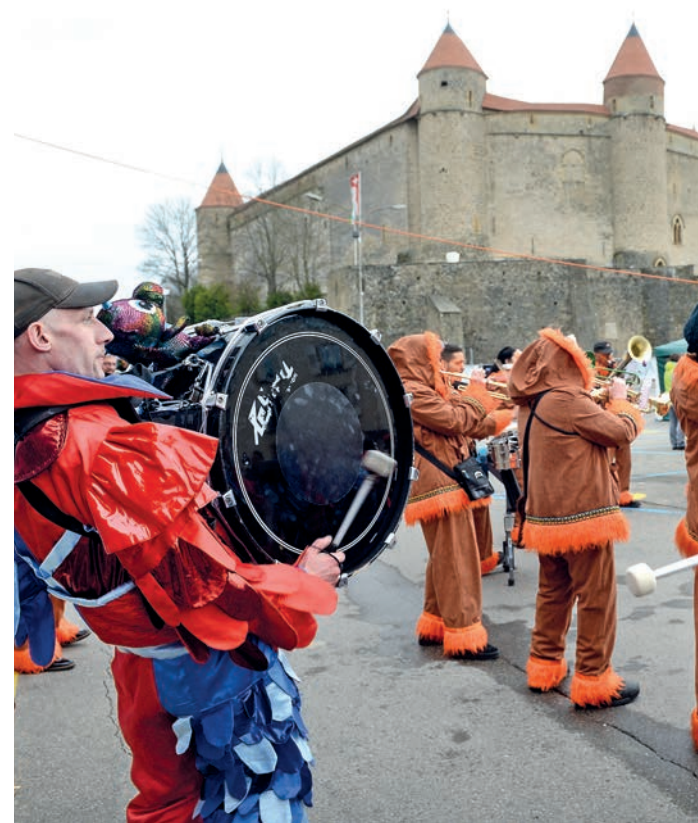
Les Z'ôtres Brandons lors de la grande première de 2020. DUPERREX-A

Constitué de membres de huit sociétés locales, le comité est habitué à jongler avec les multiples embûches pour organiser sa manifestation. En 2020, après avoir repris au pied levé le concept suite à l'arrêt de l'ancien comité des Brandons, il avait dû faire face aux prémices de la pandémie, à une météo capricieuse et à une fusillade dans le village (!). Coûte que coûte, ses membres ont tenu bon et grâce à l'incroyable solidarité entre les sociétés, la fête fut belle.