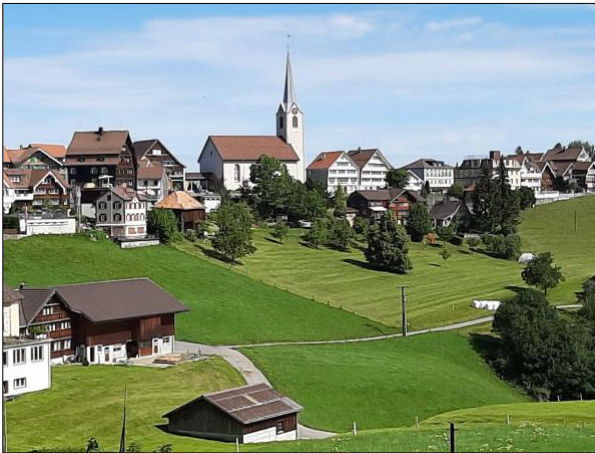
Le village-rue de Schwellbrunn (AR)

Schwellbrunn et Trogen sont deux villages emblématiques de l'arrière-pays appenzellois, accrochés à leur butte d'où se dégage une vue grandiose du lac de Constance jusqu'à la chaîne de l'Alpstein. Tous deux sont inventoriés sur la liste des sites construits d'importance nationale (ISOS) et classés parmi les Plus Beaux Villages de Suisse, en tant qu'uniques représentants du demi-canton d'Appenzell Rhodes-Extérieures.