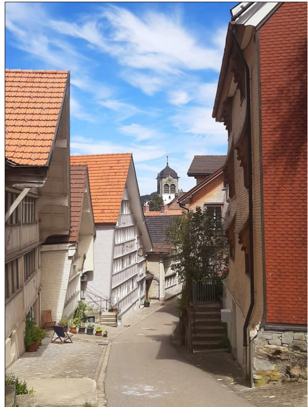
Ruelle tortueuse de Trogen (AR)

Au centre de Trogen, l'église baroque impressionne par sa façade à colonnes imposantes donnant accès à des décors intérieurs somptueux. Les divers styles architecturaux du village cohabitent dans une parfaite harmonie et en font un site construit d'une grande valeur patrimoniale. Le repavage complet en cours du centre promet une sublimation esthétique des lieux, alors que l'auberge Krone atteint déjà un sommet de ravissement.